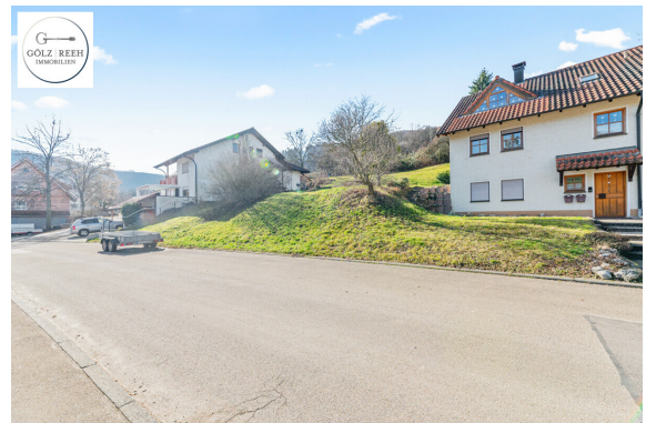
Ansicht von Straße