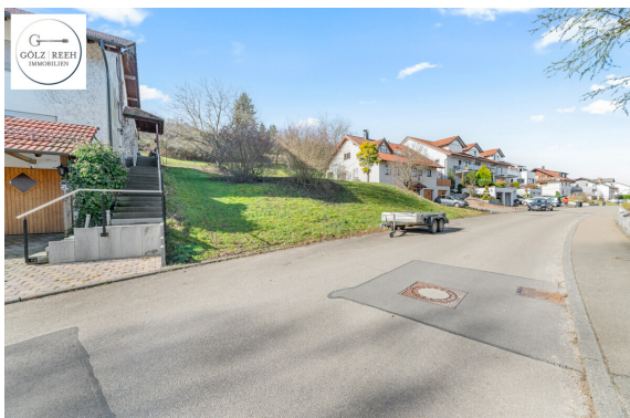
Ansicht von Straße