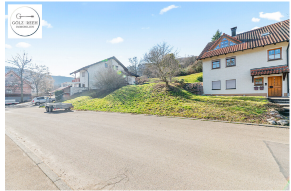
Ansicht von Straße