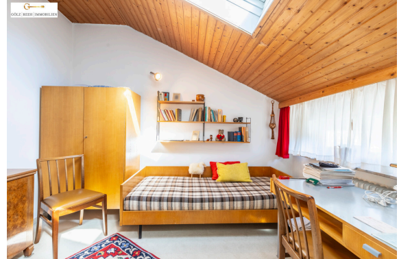
Zimmer 4 OG_