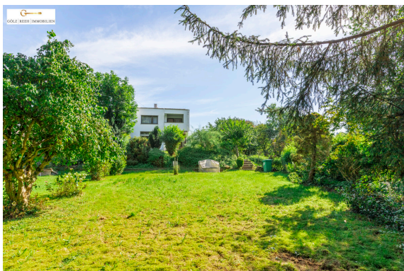
Blick auf das Objekt / Garten