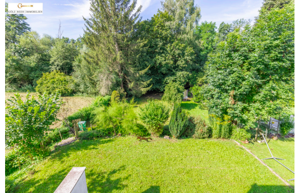
Blick von der Loggia