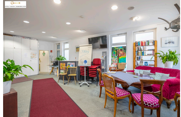
Blick zum Ausgang