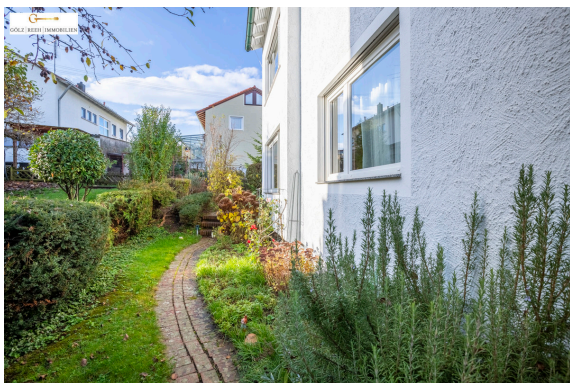
Weg um das Haus