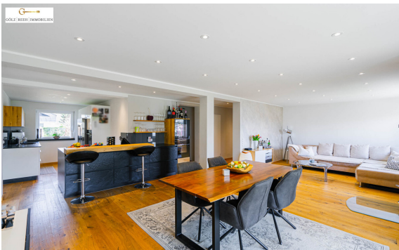
Essen / Küche