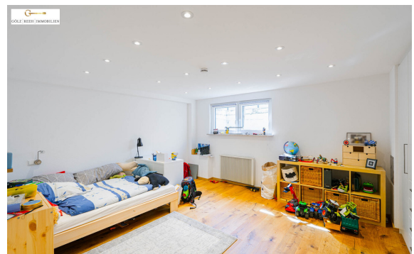
Zimmer 1 UG