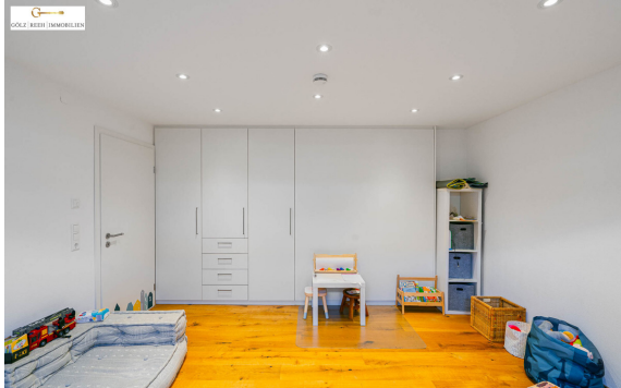
Zimmer 2 UG