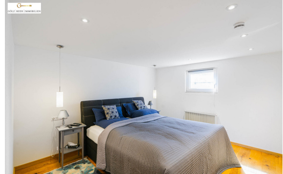
Zimmer 3 UG