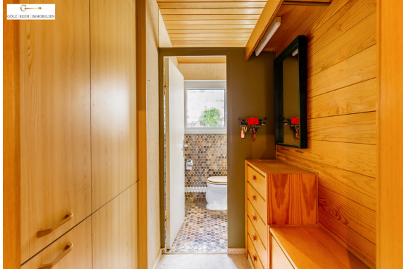
EG Gard. + WC