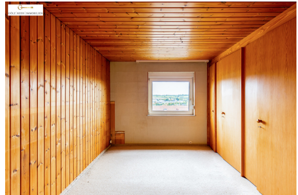
EG Schlafen 1