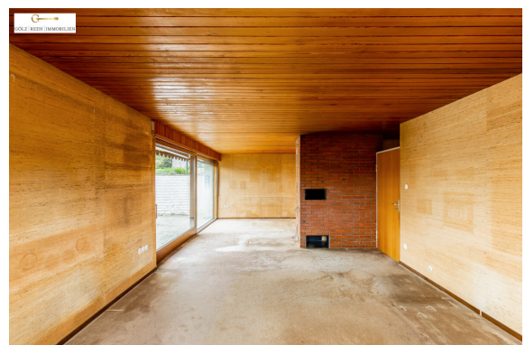
EG Wohnen / Essen